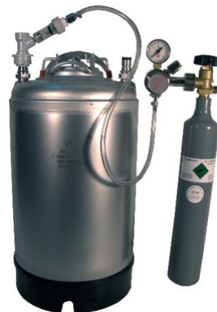
Article RP1102GN et Soda Club Bouteille de CO2 attachée à Bidon de 11 litres