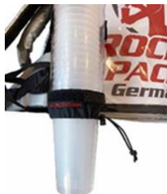
Distributeur de gobelets universel pour gobelets jetables et réutilisables

Sac à dos pour boissons avec isolation (jusqu'à 2 heures). Pour servir deux types de produits à partir d'un sac à dos. Convient de préférence aux boissons froides. Fonctionnement par gravité de boissons non gazeuses, pas besoin d'utiliser d'équipement sous pression supplémentaire. La distribution de boissons gazeuses nécessite l'utilisation d'un équipement sous pression supplémentaire. La pompe à air mécanique avec raccord en T est la méthode la plus adaptée à cet effet. Idéal pour un service rapide des boissons !