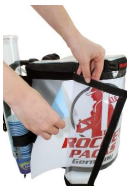
Décoration publicitaire flexible par insertion de papier derrière la feuille