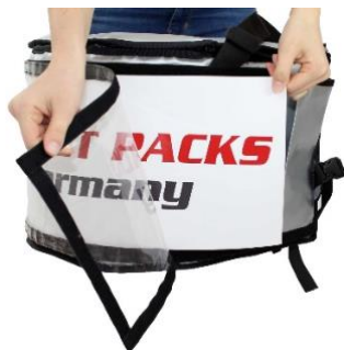
Changement flexible de messages publicitaires