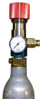
Article RP1102GN Régulateur de CO2 pour Soda-Club bouteille (Aluminium)