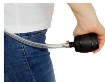
Fonctionnement avec mini-pompe à air comme équipement sous pression