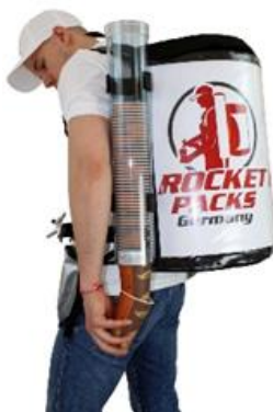
Distributeur de gobelets pour les tailles de tasse de 100 à 550 ml