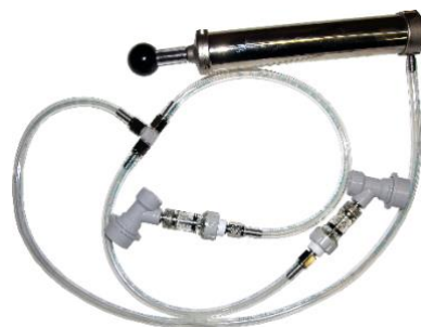
Pompe à air avec connecteur en T