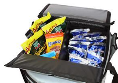
Marqueterie (séparation de pièce), garde le plateau bien rangé