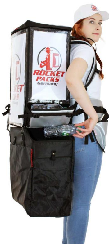
Pack double avec sac poubelle pour vide

Demandez-nous simplement des solutions et des prix.