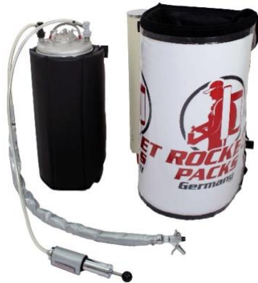
Illustration : Caractéristiques du produit pour les boissons gazeuses