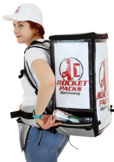
Échangeable flexible messages publicitaires !