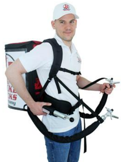
Sac à dos léger

En utilisant la pompe à air, elle convient également au fonctionnement au CO2 !