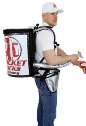
Pro 11 litres, assure une apparence de marque professionnelle

Sac à dos professionnel pour boissons Isolation jusqu'à 4 heures