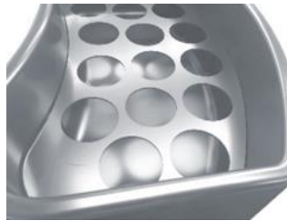
Illustration avec deux séparateurs