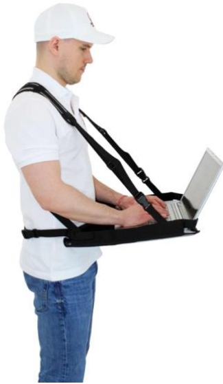
Supporteur d'ordinateur portable pour les appareils jusqu'à 18 pouces

Tablette de travail confortable et mobile pour ordinateurs portables jusqu'à 18 pouces, avec système de bandoulière réglable croisée dans le dos. Avec épaulettes et larges bretelles. Construction ergonomique. Les bandes VELCRO fournies fixent l'appareil sur la table de travail et garantissent une manipulation optimale.