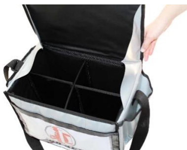
Appareil à chambre en 4 parties