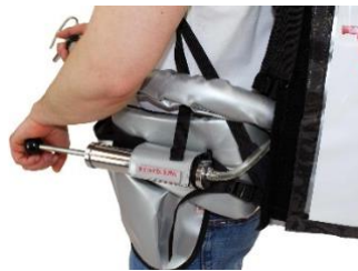
Pompe à air manuelle comme équipement sous pression * Autres accessoires de pression sur demande*

La variante XL de Service de boissons mobile !