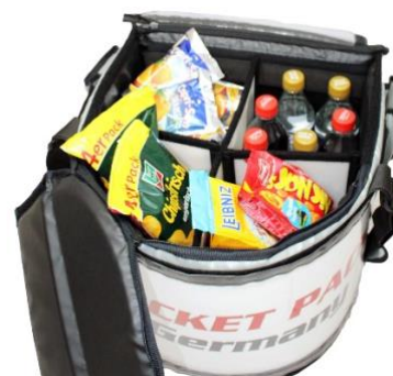
Marqueterie (séparation de pièce), garde le plateau bien rangé