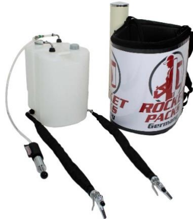
Illustration : Caractéristiques du produit pour les boissons gazeuses