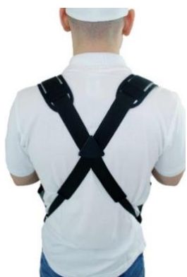
Système de bandoulière ergonomique avec épaulette réglable

Particulièrement adapté à une utilisation avec des canettes et des bouteilles de 500 ml !