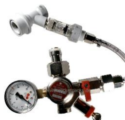
Article RP1102GN Régulateur de CO2 pour Soda-Club bouteille (Aluminium)