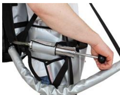
Pompe à air manuelle comme équipement sous pression * Autres accessoires de pression sur demande*