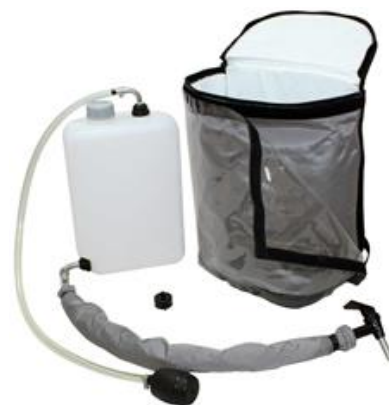
Illustration : Caractéristiques du produit pour les boissons gazeuses