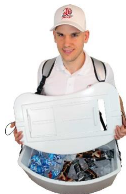
Couvercle coulissant amovible

Sachet en aluminium et couvercle coulissant