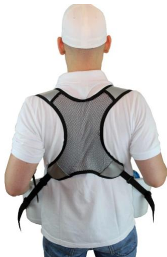
Ergonomique à 4 points bandoulière

Idéal pour les glaces et autres produits surgelés !