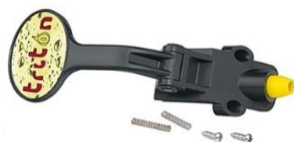
Robinet avec vis