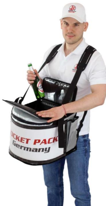
Insert à 15 trous pour la stabilisation de canettes, de bouteilles et de tasses