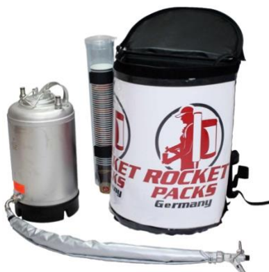
Illustration : Caractéristiques des produits pour les boissons non gazeuses