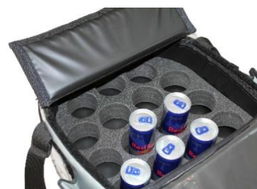
Trou Ø 70 mm, Hauteur 50 mm