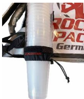
Distributeur de gobelets universel pour gobelets jetables et réutilisables