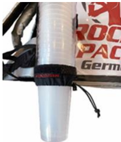
Distributeur de gobelets universel pour gobelets jetables et réutilisables