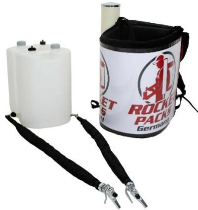
Illustration : Caractéristiques des produits pour les boissons non gazeuses