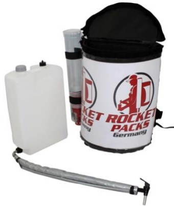
Illustration : Caractéristiques du produit pour boissons non gazeuses