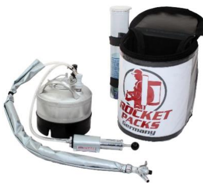
Pompe à air manuelle comme équipement sous pression