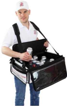
Changement flexible de publicité

Plateau de présentation de grande capacité, thermo-isolé, pour une large gamme d'applications. Des matériaux et une finition de haute qualité garantissent stabilité et durabilité. Couvercle relevable amovible, système de bandoulière avec épaulette réglable dans le dos en travers, assurent un confort de port optimal. Avec deux poches latérales à l'extérieur pour les accessoires de service ou la poche à monnaie. L'avant et le couvercle (intérieur) peuvent être décorés à des fins publicitaires. Lorsque vous utilisez le plateau avec couvercle, il convient également à la distribution de produits à base de glace !