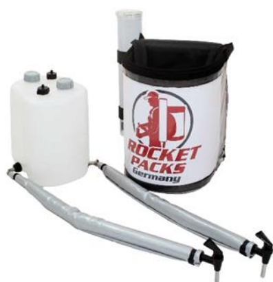
Illustration: Caractéristiques du produit pour aucun boissons gazeuses