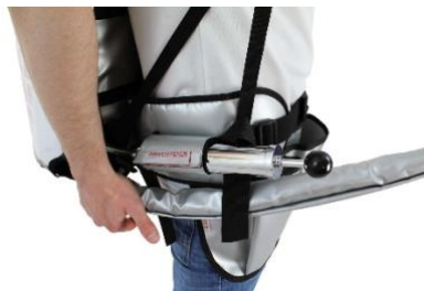
Pompe à air manuelle fixée au harnais du sac à dos