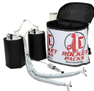
Illustration : Caractéristiques du produit pour les boissons gazeuses