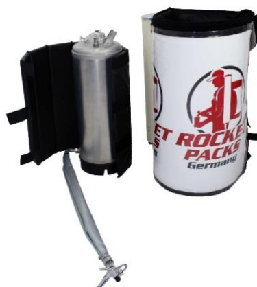
Illustration : Caractéristiques des produits pour les boissons non gazeuses