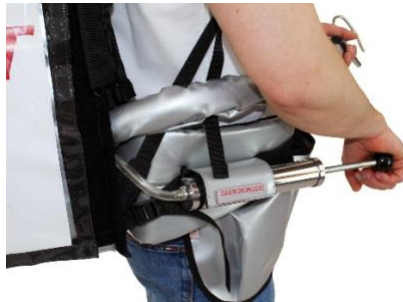
Pompe connectée au sac à dos