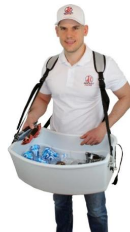
Plateau à glace excl.

Sachet en aluminium et couvercle coulissant