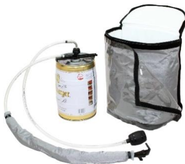
Contenu de la livraison : Party-Pack pour canette de bière ALU de 5 litres