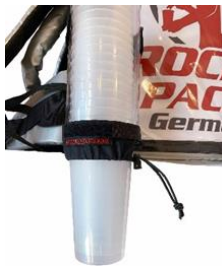
Distributeur de gobelets universel pour gobelets jetables et réutilisables