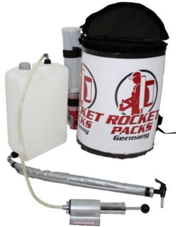
Illustration : Caractéristiques du produit pour boissons non gazeuses