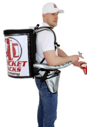
Pro 11 litres, assure une apparence de marque professionnelle

Sac à dos professionnel pour boissons Isolation jusqu'à 4 heures