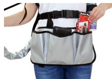
Tablier de vendeur avec 3 sacs avant