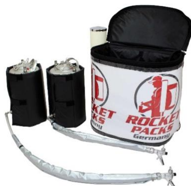
Illustration : Caractéristiques des produits pour les boissons non gazeuses