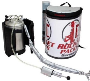
Illustration : Caractéristiques du produit pour les boissons gazeuses