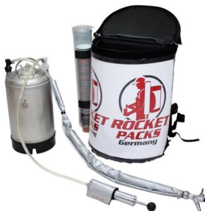
Illustration : Caractéristiques du produit pour les boissons gazeuses