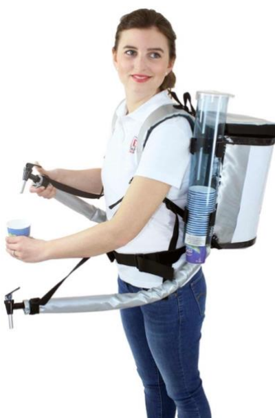
...de préférence adapté pour les boissons fraîches !