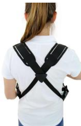
Système de bandoulière ergonomique avec épauillère réglable

Le plateau isotherme est adapté à une large gamme d'applications. Des matériaux et une finition de haute qualité garantissent stabilité et durabilité. Le couvercle relevable amovible, le système de bandoulière avec épaulette réglable dans le dos en travers, assurent un confort de port optimal. Avec deux poches latérales à l'extérieur pour les accessoires de service ou la poche à monnaie. L'avant et le couvercle (à l'intérieur) peuvent être décorés de des fins publicitaires. Lorsqu'il est utilisé, le plateau avec couvercle convient également à la distribution de produits à base de glace !