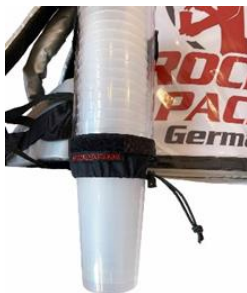
Distributeur de gobelets universel pour gobelets jetables et réutilisables