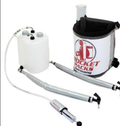
Illustration: Caractéristiques du produit pour boissons gazeuses