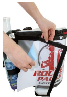
Décoration publicitaire flexible par impressions sur papier derrière une feuille