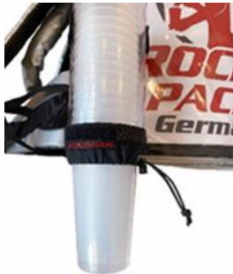
Distributeur de gobelets universel pour gobelets jetables et réutilisables