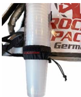
Distributeur de gobelets universel pour gobelets jetables et réutilisables