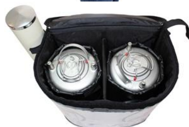
2 isolés séparément contenant à boissons de 11 litres