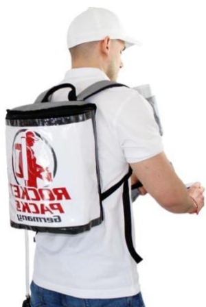
Illustration : Caractéristiques des produits pour les boissons non gazeuses

Sac à dos simple pour boissons, avec isolation modérée, adapté à toutes les occasions. Convient de préférence aux boissons froides. Pour les boissons plates, la vidange s'effectue par gravité - aucun accessoire de pression supplémentaire n'est nécessaire. Lorsque le sac à dos est utilisé avec des boissons gazeuses, la mini-pompe à air doit être utilisée comme accessoire de pression.