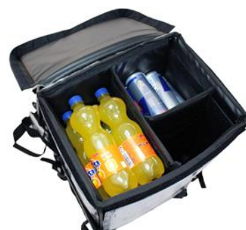
Appareil à 2 chambres avec capacité de chargement de 15 canettes ou bouteilles jusqu'à 500 ml chacun