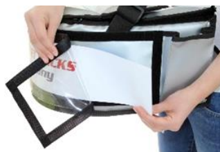
Changement flexible de messages publicitaires