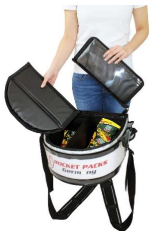
Couvercle relevable entièrement amovible