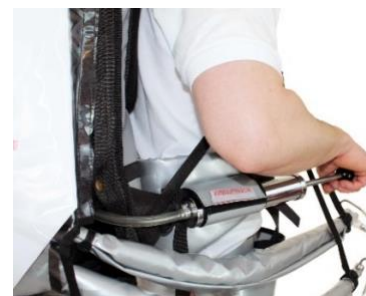
Pompe à air manuelle comme équipement sous pression