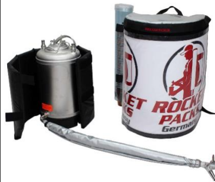
Illustration : Caractéristiques des produits pour les boissons non gazeuses