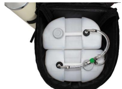
Pompe avec connecteur en T attaché au sac à dos Kombi 2x 15 litres