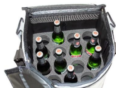
Trou Ø 70 mm, Hauteur 50 mm