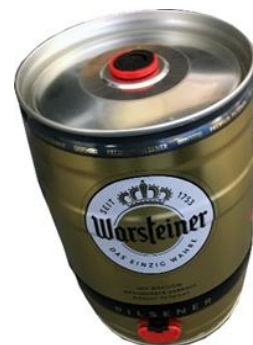
Canette de bière de 5 litres