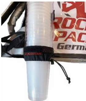
Distributeur de gobelets universel pour gobelets jetables et réutilisables