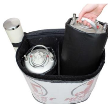
2 isolés séparément contenant à boissons de 11 litres