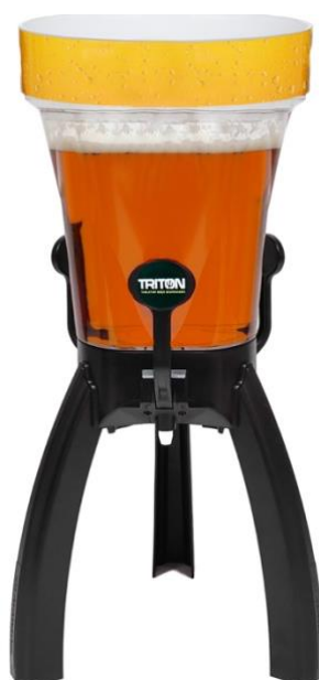
Classique 5 litres