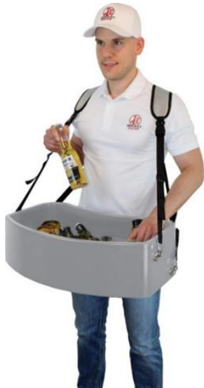
Illustration sans sachet en aluminium

- Plateau de vente flexible et applicable entièrement en plastique -